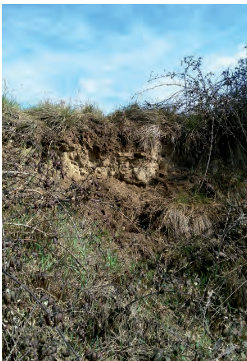
FIGURES 9 i 10. Imatges del puig dels Jueus i de la paret localitzada.