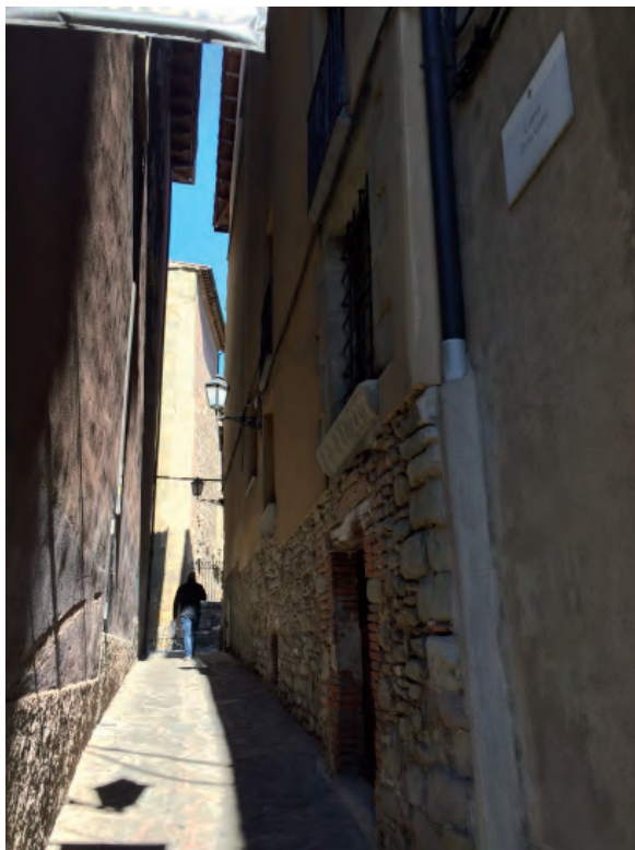
FIGURA 5. Imatge actual del carrer d'en Guiu.

El document del 1277 de compra d'un solar per a construir-hi la sinagoga indica les afrontacions amb claredat i permet situar sobre un plànol actual de Vic una nova ubicació de la sinagoga, precisament a l'altra banda d'on fins ara s'havia suposat que era. 67 Seguint el document, la sinagoga termenejava per ponent amb el carrer públic (sense dir quin és), que era per on tenia entrada i sortida, i ocupava una part del solar d'Arnau Miró, afrontant amb l'hort i pati del mateix Miró i de Berenguer Erumir, i amb una paret que donava a les cases d'en Guillem Ral, sabater. Aquestes afrontacions coincideixen amb el carrer d'en Guiu actual, per on es devia entrar a la sinagoga per una porta oberta a ponent, i amb la zona posterior de Can Franquesa, on s'han trobat restes d'una mena de cisterna d'origen romà.