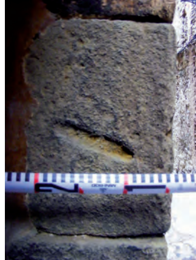
FIGURA 2. Detall de la mezuzà localitzada al carrer de l'Albergueria.

Com es pot observar a les imatges, la pedra amb el forat de la mezuzà està situada al terç superior dret de la porta, abans de començar l'arc. El carreu amb el forat mesura 50-55 cm de llargada, entre 29 i 36 d'alçària i entre 19 i 21 cm d'amplada. La mezuzà, picada a la cara que correspon a l'amplada, té unes mesures que es troben dins els paràmetres d'altres forats de mezuzà coneguts: cilíndric i arrodonit pels dos extrems, mesura 110 mm de llargada, 20 mm d'amplada i entre 8 i 10 mm de profunditat.