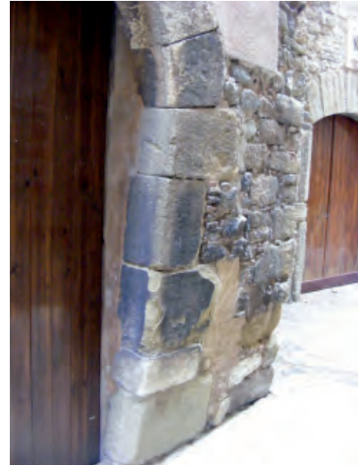
FIGURES 3 i 4. Situació de la mezuzà al carrer de l'Albergueria.