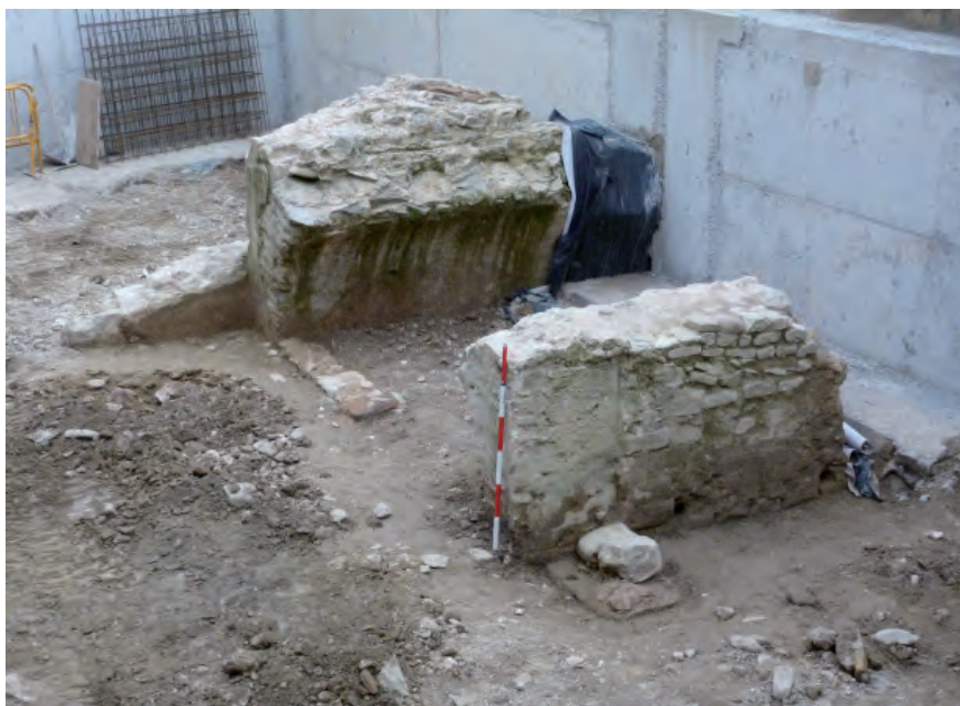
FIGURES 6 i 7. Excavació de Can Franquesa, amb el possible micvé.